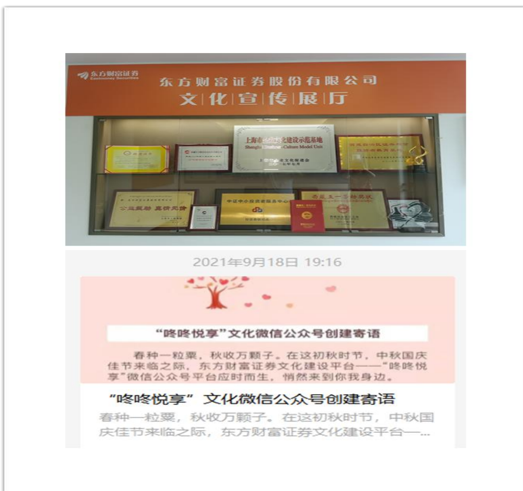
（图片说明：公司文化宣传展厅、文化微信公众号“咚咚悦享”创建）

心入脑，营造良好的文化氛围。对外宣传方面，发表“证券公司董事长谈文化建设与高质量发展”专栏约稿《文化铸魂，科技赋能，谱写新时代高质量发展新篇章》，同时积极向中国证券报、每日经济新闻、申融党建、上海金融 APP、《西藏金融》等媒体投稿，宣传行业和公司文化。