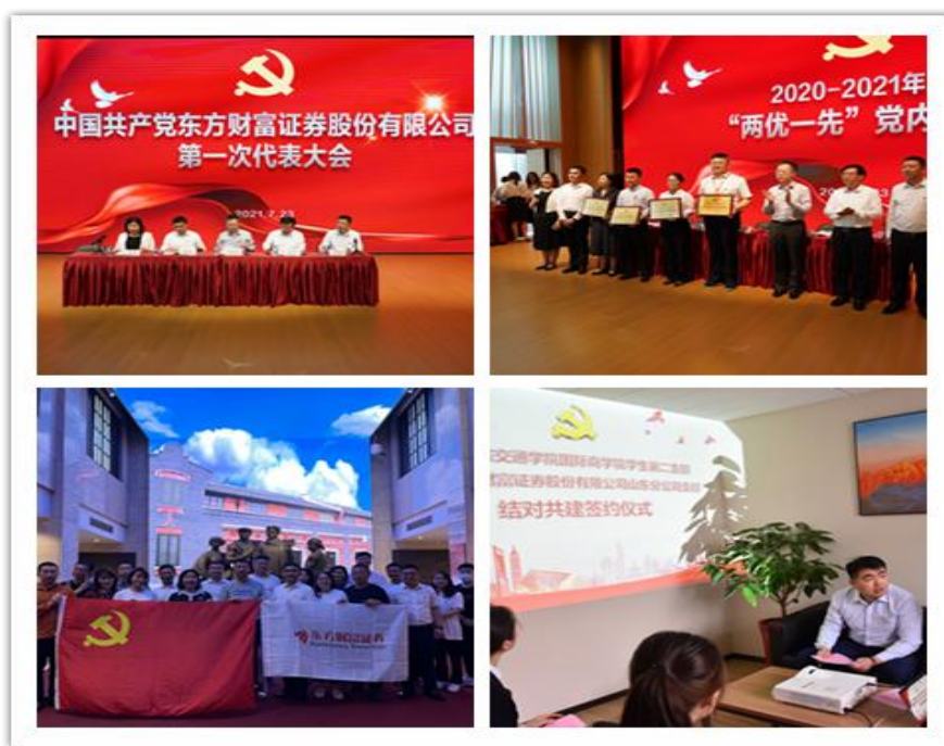
（图片说明：党建引领，文化建设与党建工作相促进）

公司积极探索“党建+”模式，统筹推进党建带工建、党建带青妇、党建带企业文化、党建带社会责任的“五位一体”的工作模式，推动党建与中心工作同频共振，以高质量党建引领公司高质量发展和文化建设。