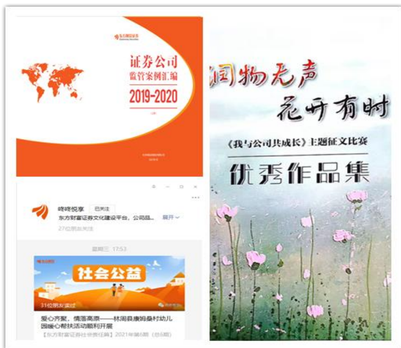
（图片说明：公司征文比赛作品集、监管案例汇编）

在文化活动方面，公司积极打造“东财享悦读”读书会品牌，2021 年分别推出线上读书会、女性读书分享会、党史读书分享会等系列读书活动；开展文化建设微信公众号昵称征集活动；组织建党百年、部门团建、健康跑、去总文化月、年终援藏义卖等文化主题活动，助力文化理念落地生根。