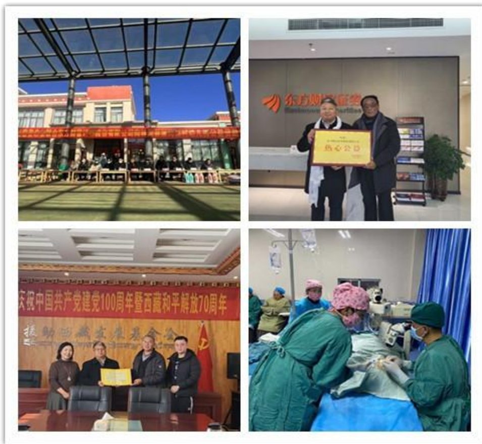
（图片说明：林周康姆桑村幼儿园帮扶、西藏自治区慈善总会、援助西藏发展基金会公益捐助，慈善光明行无偿白内障手术）

报告期内，公司正式设立了社会责任委员会及一级部门社会责任部，将社会责任上升至公司战略高度，开启社会公益事业新征程。报告期内，公司向三个结对帮扶县捐赠教育奖学金，用于资助每个县 10 名大学生完成学业；从三个结对帮扶县采购消费帮扶产品。同时，在三县开展智力帮扶，对当地基层干部、专业技术人员、乡村振兴带头人等进行金融知识培训，增强“造血”能力。除在结对帮扶县开展的教育帮扶以外，报告期内公司在西藏其他地区和内地开展教育帮扶投入 101.69 万元：对连续帮扶