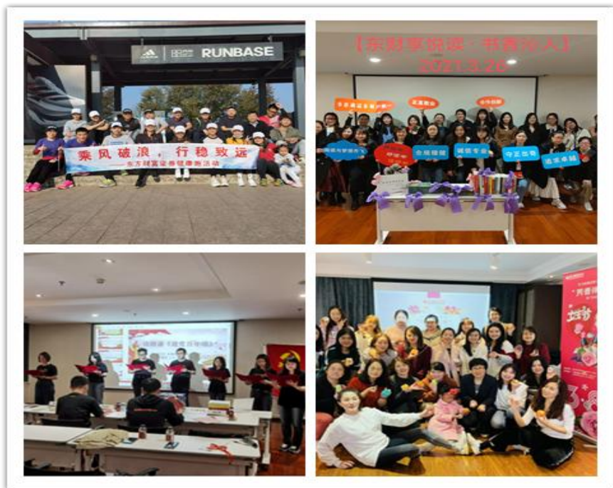
(图片说明：2021 党员读书会、三八节读书会、健康跑等文化活动)