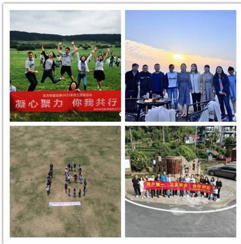
(图片说明：公司各部门团建活动)

文化项目以员工为家人。公司通过精心设计和认真组织，将企业文化的工作项目化，使无形的理念、精神、要求，变成实实在在落地的项目，践行“东财一家人”的理念。制作“我与公司共成长”征文优秀作品集；开展《父亲节，那些你想对他说的》征文活动，并制作征文作品集；结合庆祝建党 100 周年活动，慰问获得“光荣在党 50 年”纪念章的员工亲属，鼓励员工传承老党员红色基因，砥砺奋进；开展节日慰问，每年春节、端午、中秋、父亲节、母亲节、儿童节、妇女节等节日，给员工及家人送去节日的礼物及祝福，同时在新冠疫情、河南洪灾期间，向广大员工及家人送上深切的慰问和诚挚的问候。报告期内，公司工会