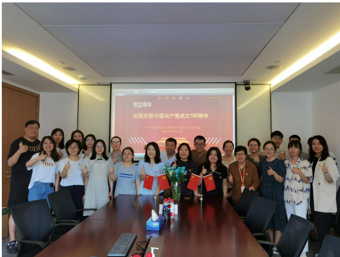
（图片说明：庆祝建党 100 周年活动）