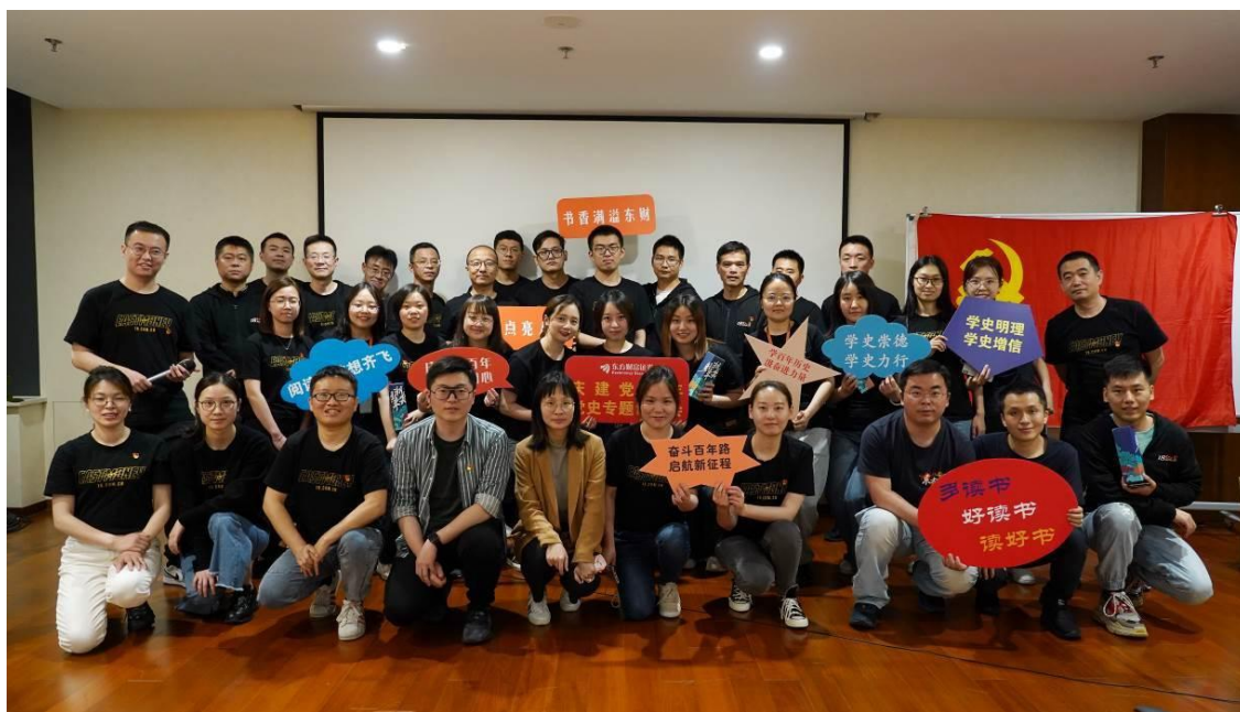
（图片说明：开展“庆建党百年，忆红色初心”党史读书分享会）