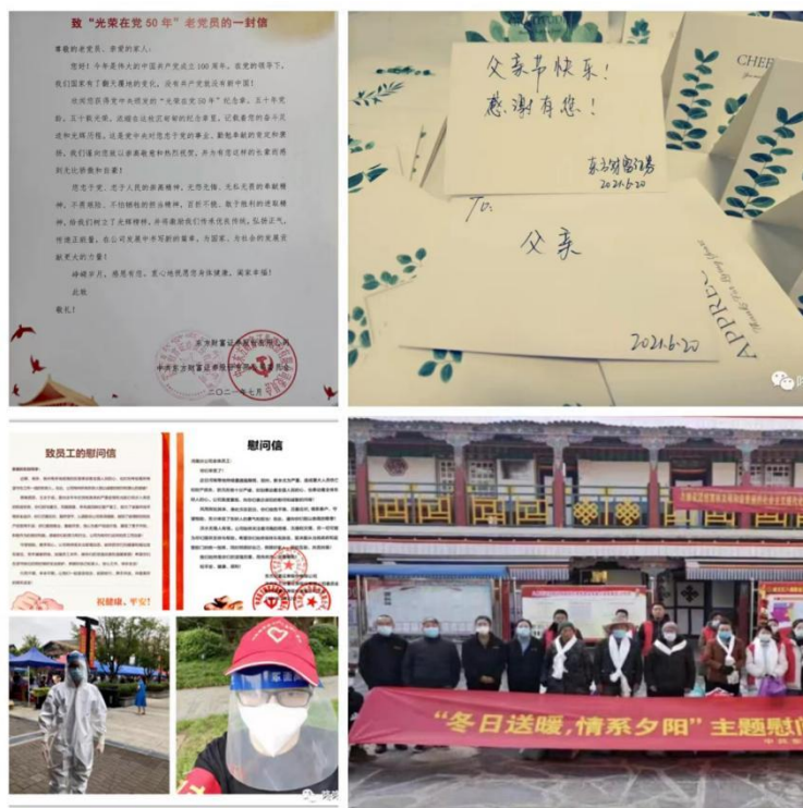
（图片说明：慰问老党员、父亲节主题征文、抗疫慰问及志愿者、敬老慰问）

推进了妈咪小屋建设，根据办公地点女职工的需求，升级改造了两间妈咪小屋，新增了屏风、室内洗手池以及沙发垫等，为哺乳期女员工提供了更加私密及舒适的哺乳环境。经上海市总工会评定，宛平妈咪小屋和平福妈咪小屋分别获评“四星级”和“五星级”小屋。这些活动项目营造出温馨和谐的“东财一家人”氛围，也增强了员工对公司的归属感和使命感。