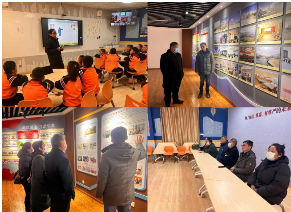
（图片说明：捐赠日喀则市上海实验学校首所梦想中心雪域 01 号场景）

报告期内，公司在履行社会责任方面投入 1,214.99 万元，为公益事业贡献力量。