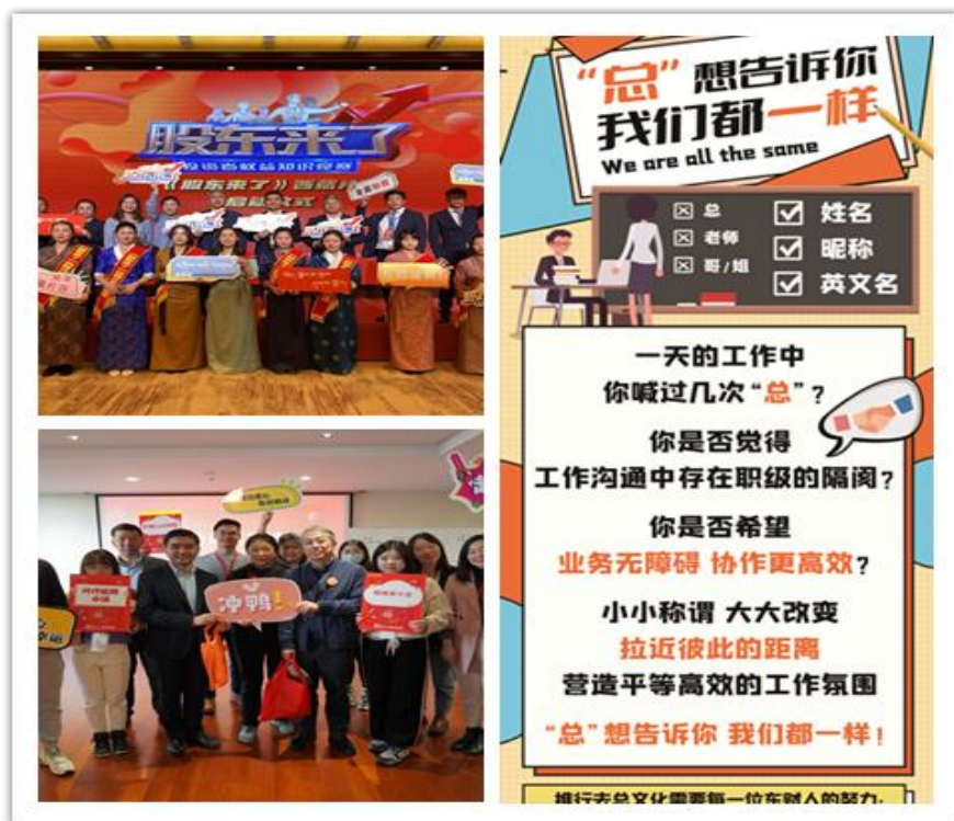
(图片说明：股东来了、年终援藏义卖、去总文化月活动)